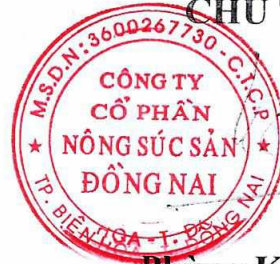
Phùng Khôi Phục